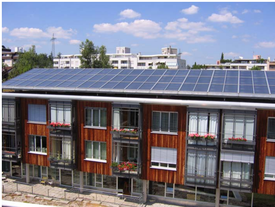
Abb: Stadteigene Solaranlage 'Rohrer Höhe'

Die Stadt Stuttgart betreibt bisher vier thermische Solaranlagen zur Warmwasserbereitung mit einer Kollektorfläche von insgesamt 248 m 2 . Zwei weitere Anlagen mit 300 m 2 Kollektorfläche sind in der Realisierung. Nahezu alle Freibäder der Stadt Stuttgart wurden mit thermischen Absorberanlagen mit einer Kollektorfläche von knapp 4 000 m 2 ausgerüstet.